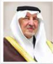
برعاية صاحب السمو الملكي الأمير خالد الفيصل بن عبدالعزيز آل سعود مستشار خادم الحرمين الشريفين أمير منطقة مكة المكرمة