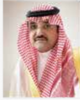
بتشريف وحضور صاحب السمو الملكي الأمير مشعل بن ماجد بن عبدالعزيز محافظة جدة